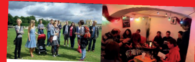
Sommersemester 2013 „Die Qual der Wahl“